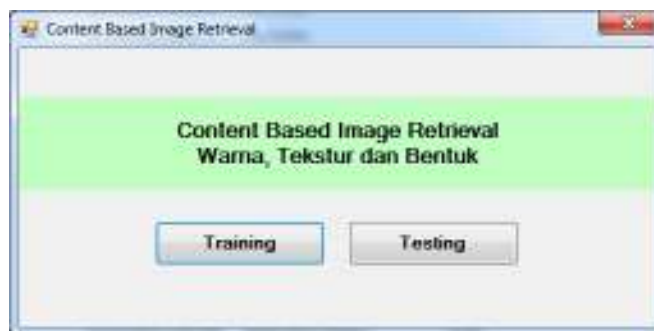
Gambar 2 Tampilan Awal Aplikasi Pencarian Gambar

Tampilan awal aplikasi pencarian gambar ditunjukkan pada Gambar 2. Tampilan awal ini terdiri dari dua pilihan utama yaitu tombol training dan tombol testing .