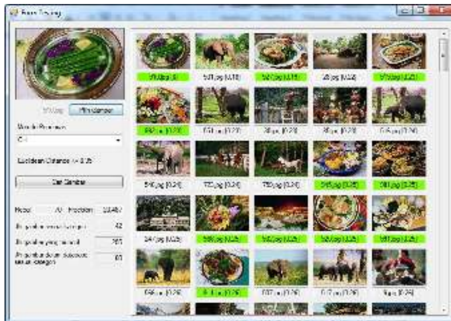
Gambar 6. Tampilan Pencarian Gambar

Tampilan testing akan muncul ketika pengguna memilih tombol testing pada tampilan awal aplikasi. Tampilan testing ditunjukkan pada Gambar 6.