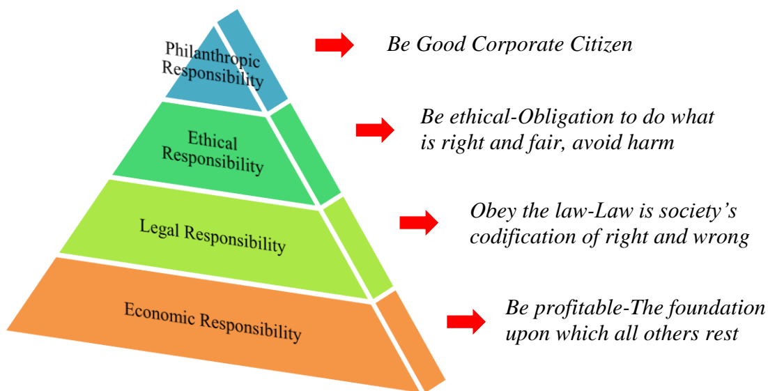
Gambar 1. Piramida Corporate Social Responsibility Carroll

Berikut adalah piramida CSR yang dikembangkan oleh Archie B. Carroll di tahun 1991, sebagaimana tampak di bawah ini :