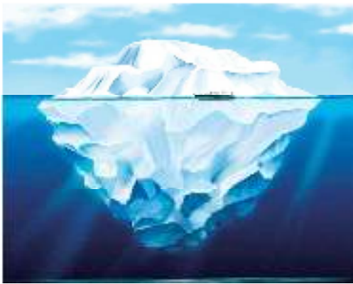
Gambar 1. Fenomena gunung es

Metode ini menggali manfaat sebanyak-banyaknya untuk menunjukkan bahwa manfaat penggunaan teknologi informasi masih banyak yang tersembunyi. Fenomena ini diibaratkan fenomena gunung es di lautan. Manfaat yang berwujud ibarat es di atas permukaan air, sedangkan manfaat yang tidak berwujud ibarat tumpukan es di dalam air. Dari fenomena ini dapat disimpulkan bahwa lebih banyak manfaat yang tersembunyi yang harus dieksplorasi agar total manfaat menjadi lebih besar dari pada pengorbanan biaya.