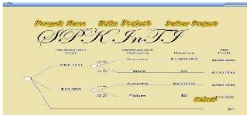
Gambar 3. Menu utama SPK InTI

Sedangkan pada sub-menu proses digunakan untuk menginput manfaat bernilai kualitatif yaitu memilih salah satu jawaban pertanyaan/kuesioner serta menganalisis kelayakan investasi TI.